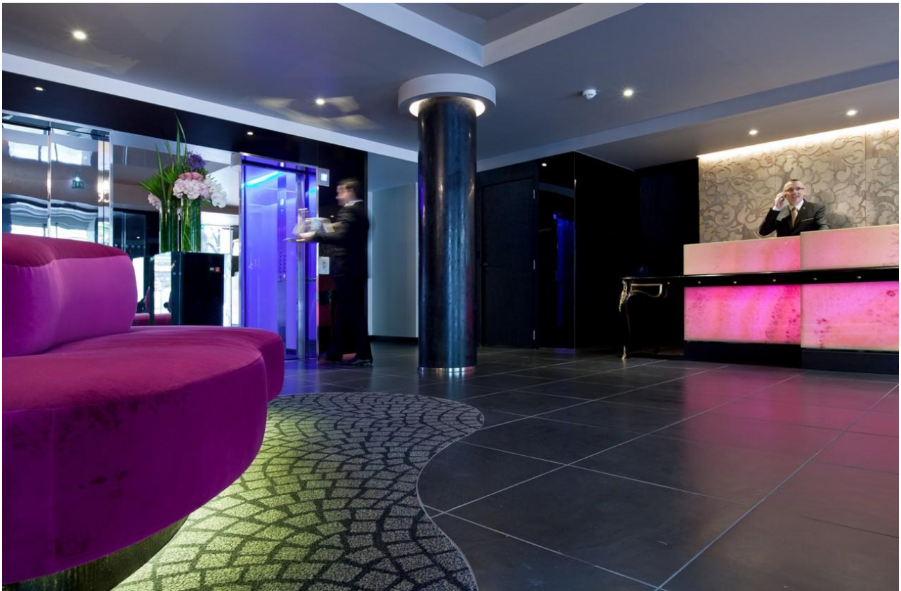
La Villa Maillot à Paris

Paris est une des plus belles villes du monde même si on ne s'en rend pas toujours compte quand on y vit. Avec ses plus beaux monuments historiques à voir, elle est devenue une destination prisée pour les touristes. Et forcément, ces visiteurs recherchent tous des expériences hôtelières haut-de-gamme et de qualité. La Villa Maillot à Paris est de ceux là. Incontestablement.