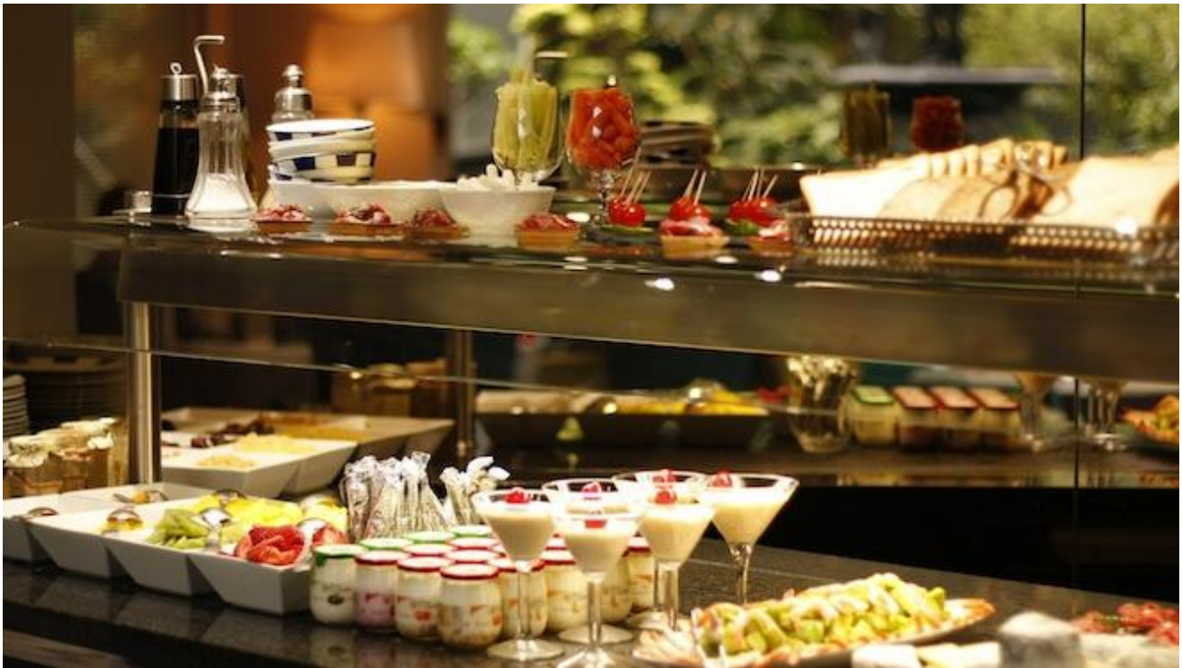
Petit déjeuner à la villa maillot à Paris

Il est alors temps d'aller s'installer dans la chambre. Prendre un bain chaud dans l'agréable salle de bain. Et oublier le temps. Vous avez même la possibilité de regarder la télévision depuis votre bain. Agréable, non ? Les 42 chambres de La Villa Maillot sont insonorisées et disposent d'un éventail de commodités, dont des docks pour iPod, un minibar et des journaux gratuits. Les télévisions à écran plat sont équipées de chaînes par satellite et de films payants, et les clients peuvent rester connectés avec un accès WiFi gratuit. Les lits sont habillés d'oreillers haut de gamme, et les salles de bains offrent des douches pluviométriques, des sèche-cheveux et des articles de toilette gratuits. Des coffres-forts compatibles avec les ordinateurs portables et les téléphones sont également disponibles.